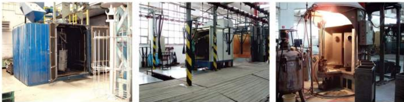
Pískování povrchu, galvanické pokovování a smaltování