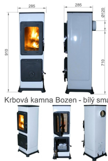
Krbová kamna Bozen - bílý smalt