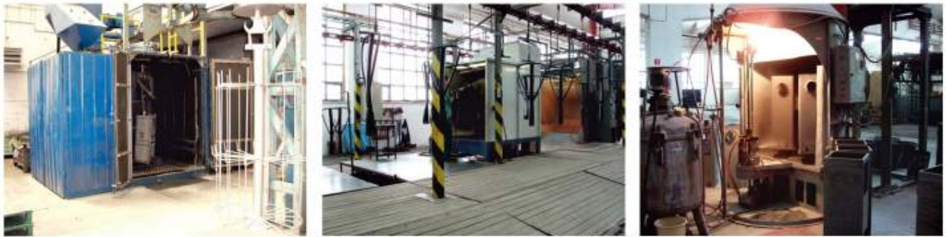
Pískování povrchu, galvanické pokovování a smaltování