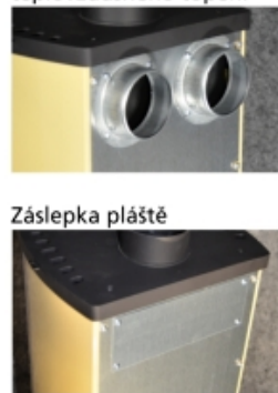
Napojení na rozvod teplovzdušného topení