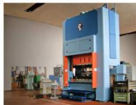
Lisování - stříhání a hohýbání, hluboké tažení a protlačování