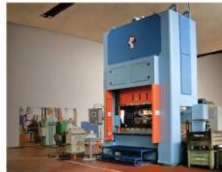
Lisování - stříhání a hohybání, hluboké tažení a protlačování