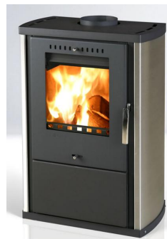
KRBOVÁ KAMNA COLMAR