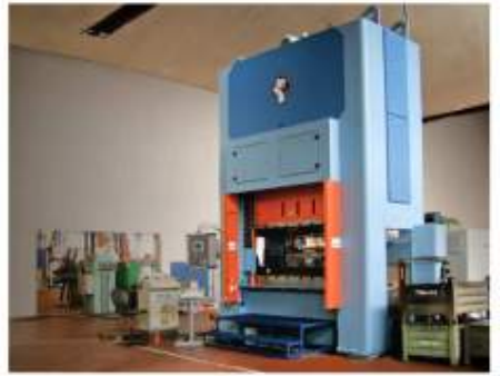
Lisování - stříhání a hohybání, hluboké tažení a protlačování