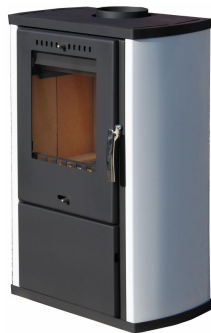
KRBOVÁ KAMNA COLMAR