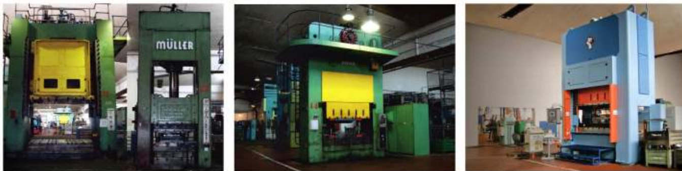
Lisování - stříhání a hohybání, hluboké tažení a protlačování