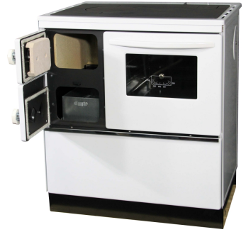
THORMA OKONOM 75 FIKO Rational - Pravy