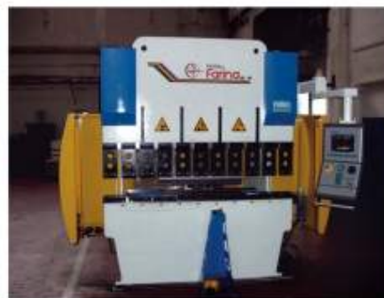
Řezání laserem, vysekávání, ohraňování