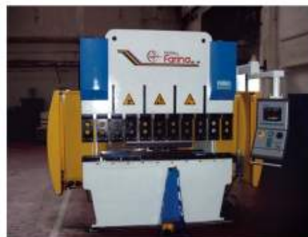
Řezání laserem, vysekávání, ohraňování